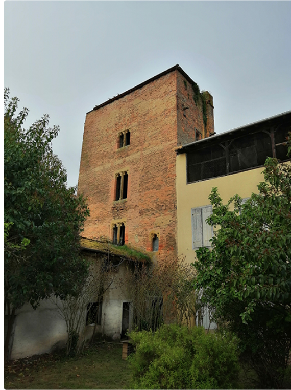
Sauvegarde de la Tour de Rohan et son jardin