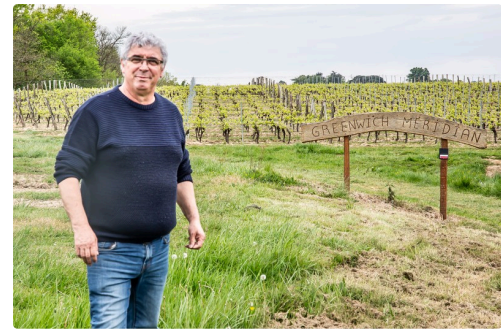
Les photos seront posées de part et d'autre du panneau (que l'on distingue sur la droite)