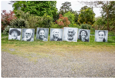
Vue générale des 7 exemples photographiés