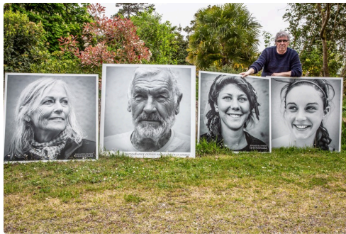
4 autres portraits