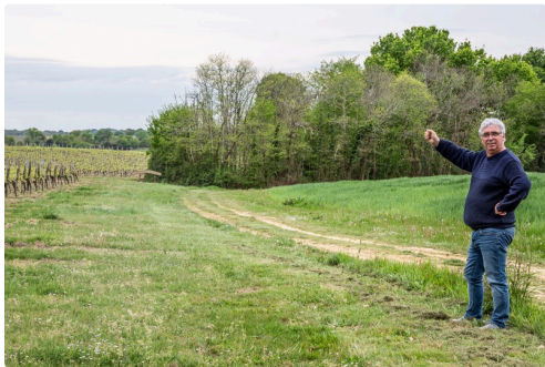
Vue de la totalité du chemin prévu pour l'exposition