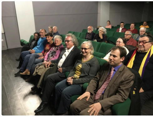
Une partie de l'assistance.