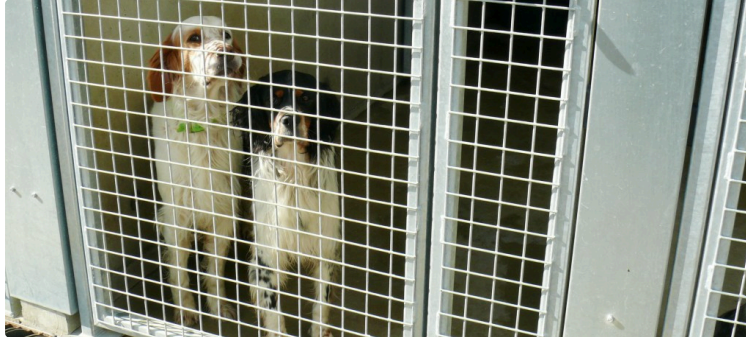
Le refuge et la fourrière départementale de la SPA ont été inaugurés