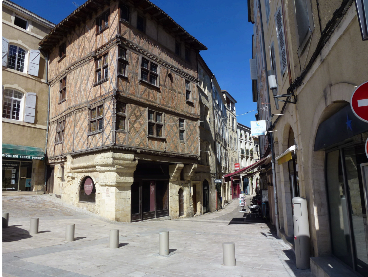
Les rendez-vous du pays d'art et d'histoire

Profitez des vacances de printemps pour découvrir ou redécouvrir le patrimoine auscitain