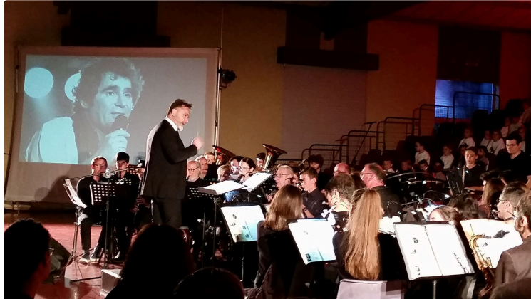
Hommage à Nougaro au concert de printemps

Une très belle soirée d'images et de son en live