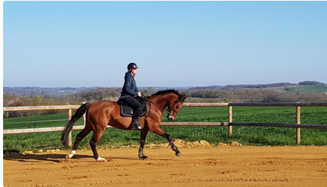
L'Écurie Wendy Terras

Une nouvelle structure équestre en terre gersoise