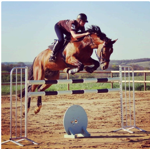
Wendy et Ultimmo, deux passionnés