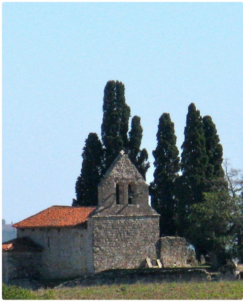
Chapelle de Tabaux