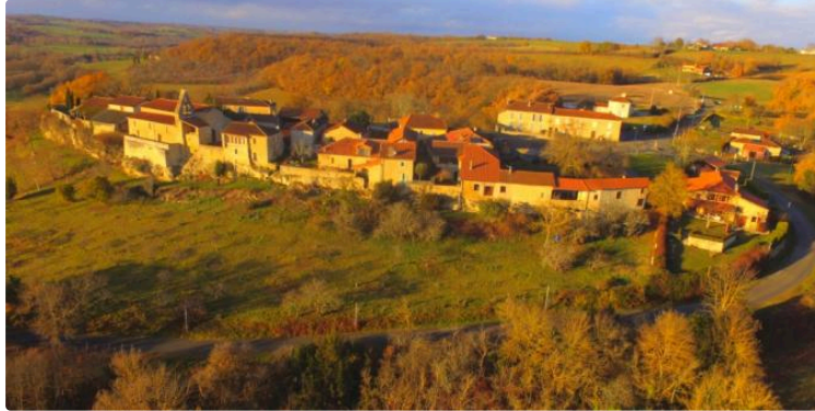
Randonnée du mardi 16 avril autour de Caillavet