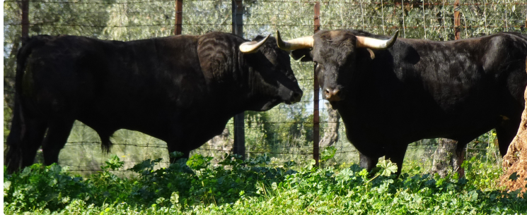
Aignan y Toros Dimanche 21 avril 2019