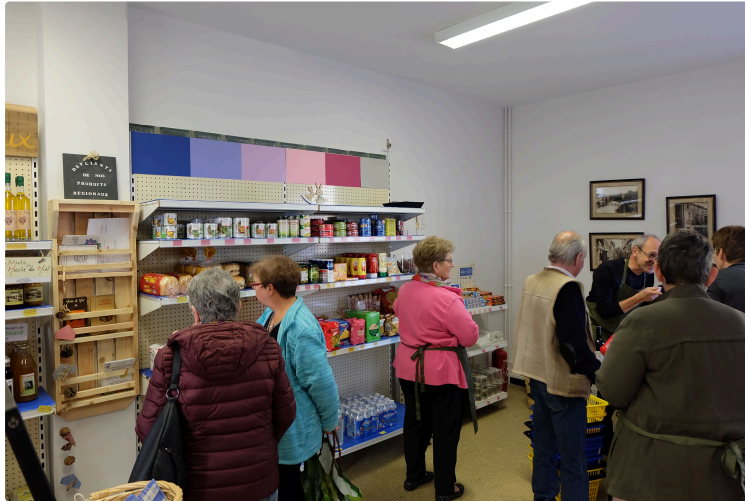
L'épicerie du Foirail aux actualités régionales

France 3 Occitanie a participé à l'inauguration du magasin, samedi 13 avril.