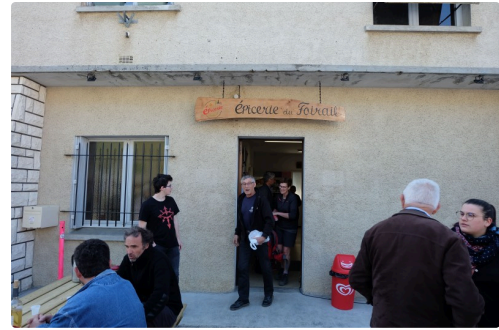
Miradoux DSCF0001 Min.jpg