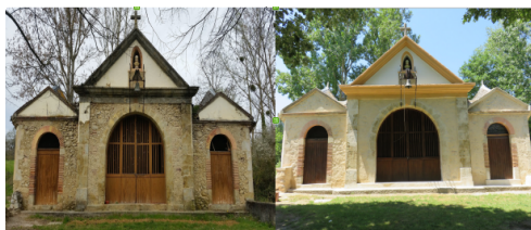
Avant .... Après