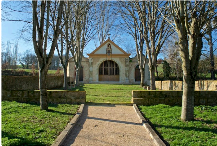
Quelques jours seulement pour terminer la toiture de la chapelle de Saintes ?

Une cagnotte pour arriver à en financer les derniers travaux