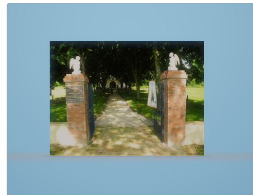
L'entrée principale avec les anges ; l'un des deux est neuf car il avait "disparu".