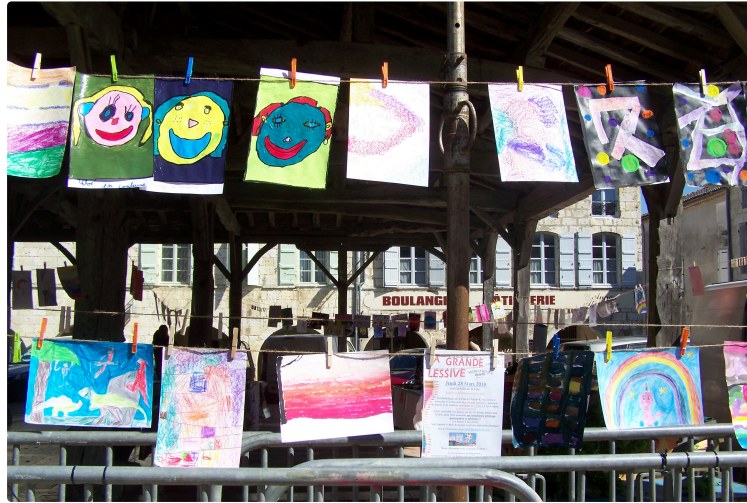
Dessins en liberté pour " La Grande Lessive"

Récemment sous la halle de Saint-Clar, a été organisée une journée événementielle. "La Grande Lessive" consiste en une installation artistique éphémère faite par tous, tout autour de la Terre, prévue deux fois par an dans des lieux publics [1].