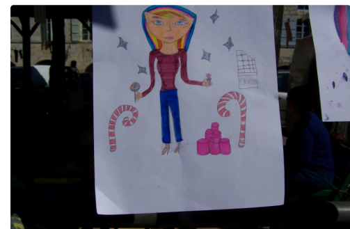
la gde lessive et photo toile expo St Clar 2019 003.JPG