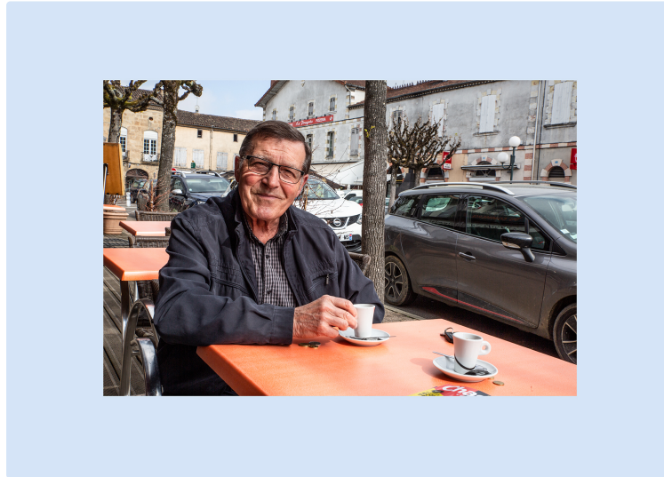
Pas de poids lourds en transit de Barcelonne-du-Gers à Manciet !

L'assemblée générale de l'association Gascogne sans poids lourds (GSPL) se réunit samedi 27 avril, à la mairie de Manciet. Toutes les personnes concernées sont invitées à y assister.