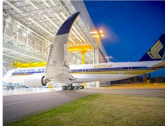
EADS : Des défis de taille pour le nouveau président

L'assemblée générale des actionnaires a entériné, ce mercredi, la nomination du nouveau président exécutif qui dirigeait jusque-là la branche aviation.