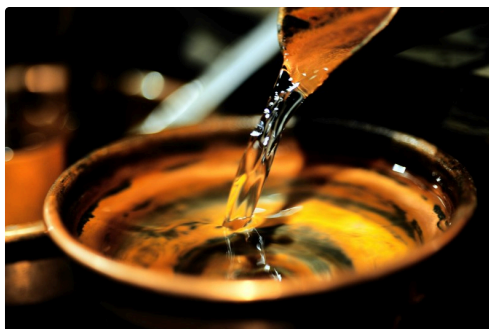
Magie des couleurs, des senteurs et des saveurs