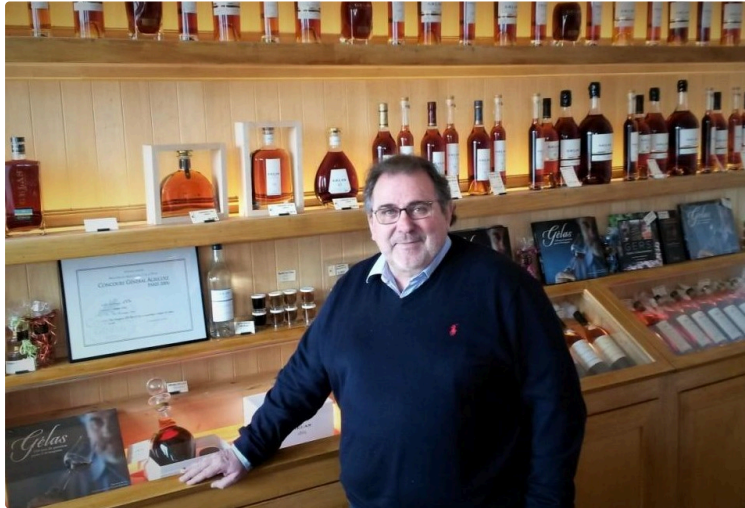
Innovation dans le domaine de l'Armagnac

La Maison Gélas lance la première cuvée « Solera »