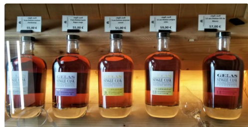
Les "Single Cask", l'armagnac façon whisky

L'abus d'alcool est dangereux pour la santé, à consommer avec modération