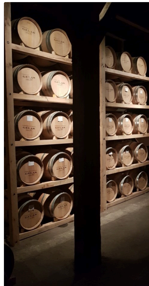
Mystérieuse Solera à l'abri des regards