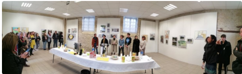
Jour de vernissage