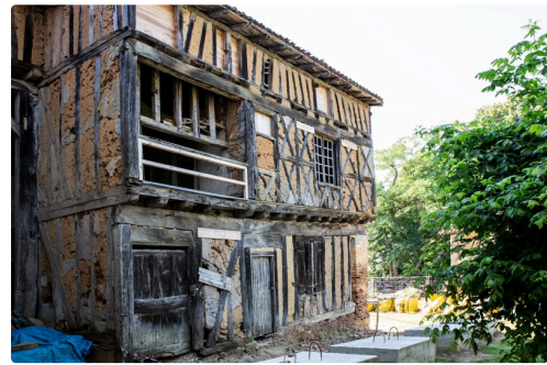
Façade opposée du castet