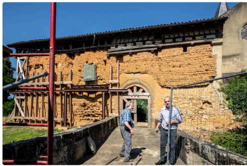
Le rempart du Castet et ses renforts actuels