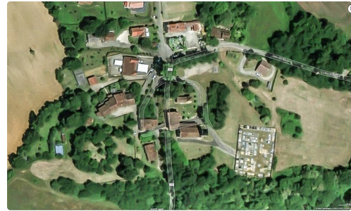
Comparer avec cette carte