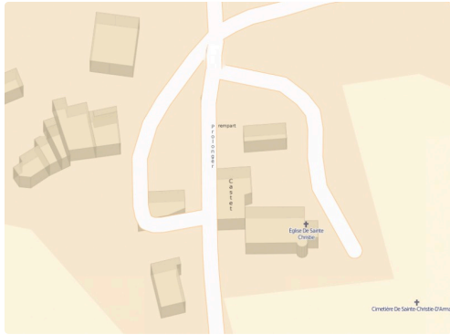
Cœur du village et prolongation éventuelle du rempart