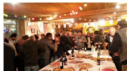
Musique et buffet