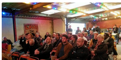
Une partie de l'assistance