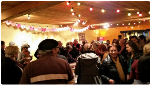
Bénévoles et partenaires