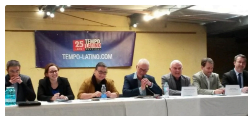
On garde le sourire

Retrouvez la présentation du festival Tempo Latino ici