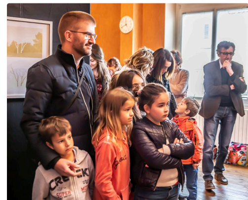
Les enfants présents vont rendre les images lumineuses