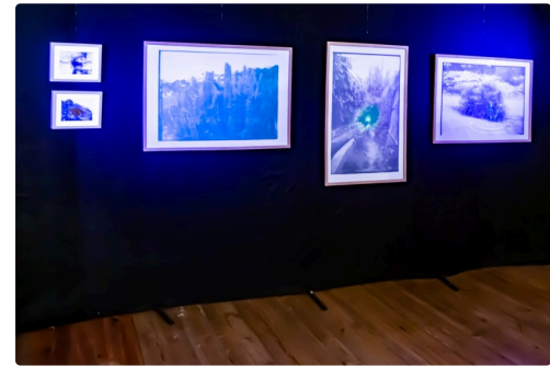
Suite d'images lumineuses