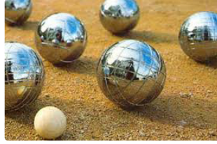
Pétanque : Championnat Départemental Vétérans

1ère Journée du Championnat Départemental des clubs