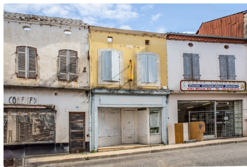
Seules les façades subsistent le 4 avril (on voit à travers les œils-de-boeuf)