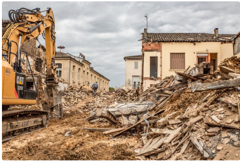
De la rue du Four, on voit la mairie et, à droite, le 3ème bâtiment à détruire