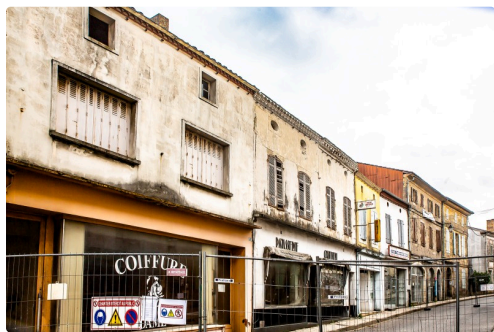
Avant la démolition, le 3 avril

On espère qu'une belle construction viendra bientôt remplacer les bâtiments disparus.