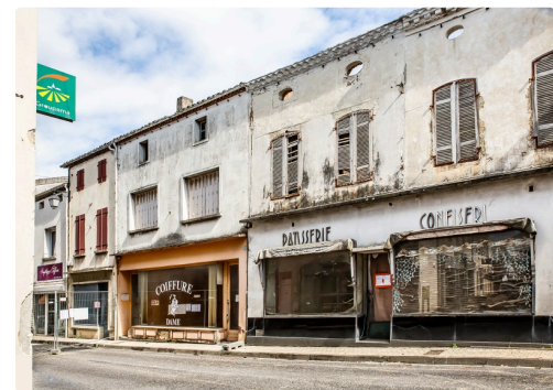
Idem le 4 avril