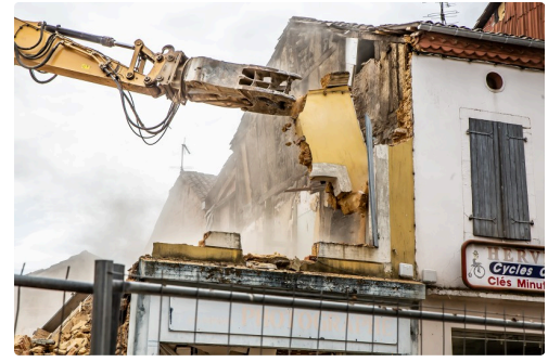
Séquence d'abattage de la façade jaune, le 5 avril (3)