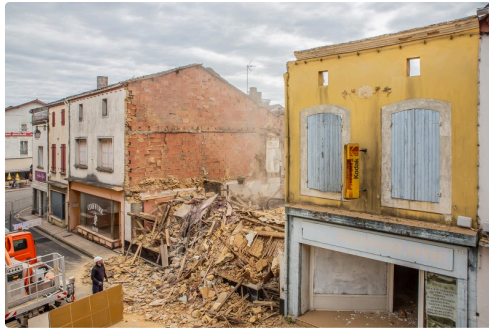
Première façade abattue, le 5 avril