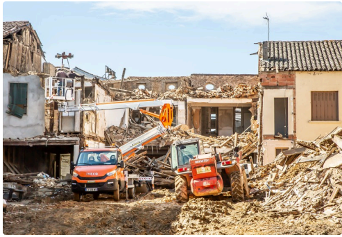
Abattage côté rue du Four, le 4 avril