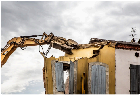
Séquence d'abattage de la façade jaune, le 5 avril (1)