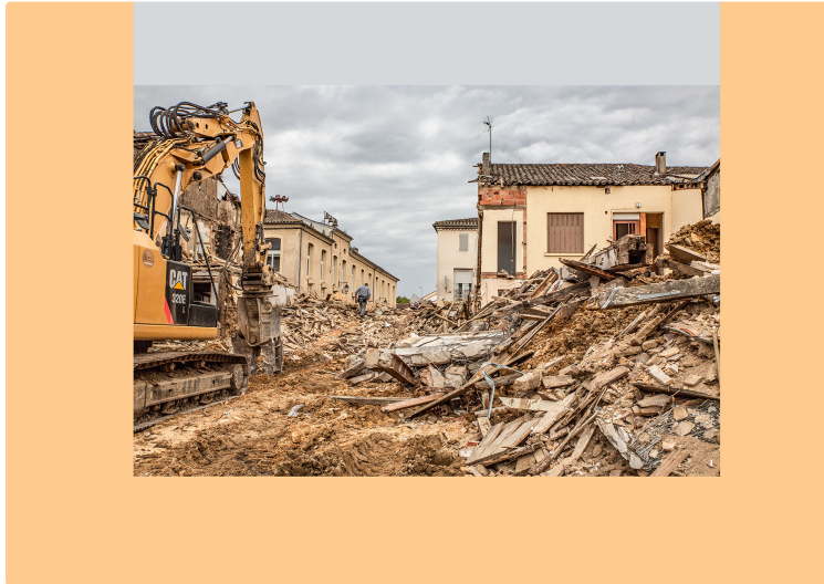
Procédure d'habitat en péril

Trois immeubles démolis ex-rue Nationale