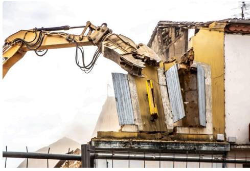
Séquence d'abattage de la façade jaune, le 5 avril (2)