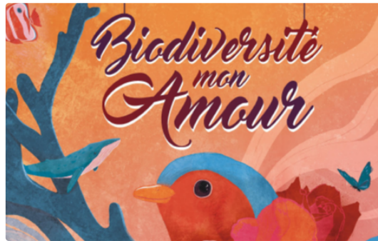
Films d'environnement au Gascogne

Festival Films et Environnement (durable?) au Gascogne du 11 au 19 avril 2019.