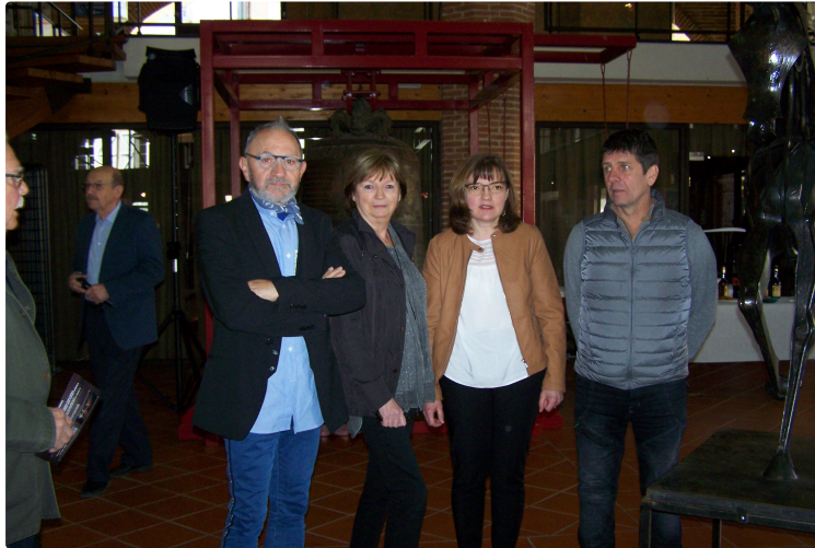
"4 Regards sur l'art" au Musée Campanaire

Un équilibre parfait pour cette nouvelle exposition