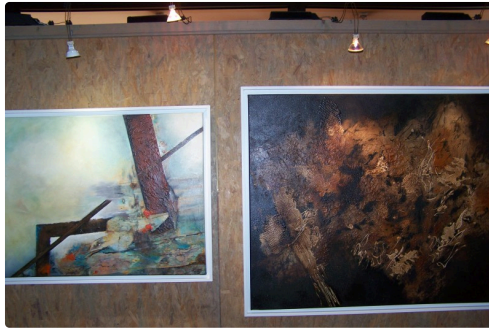
Toiles de Maité Manoni