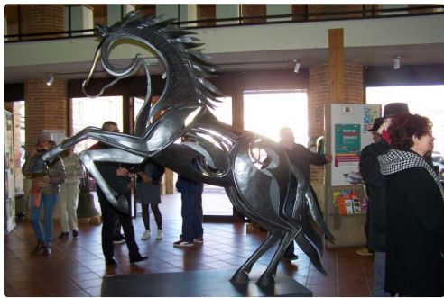
Spendide sculpture d'Emmanuel Kieffer