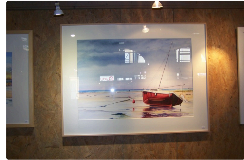
Aquarelle de Corinne Labat