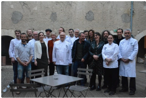
Photo de famille 2019