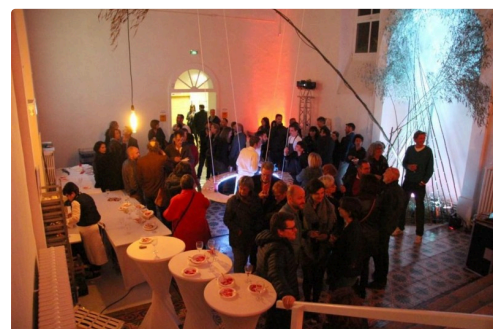
La grande salle des desserts