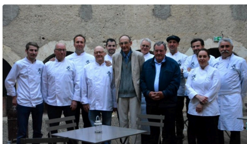
Les gagnants du concours entourés des chefs