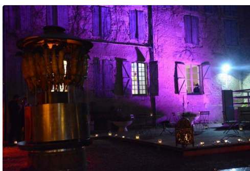
Le manège enchanté