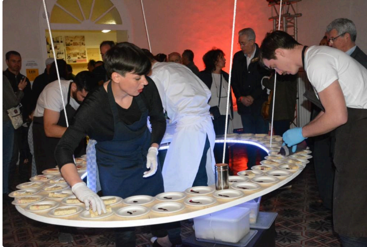
Saveurs de palais pour la soirée Archi'Cook

Du centre culturel Memento, émanaient vendredi soir des odeurs alléchantes, plutôt inhabituelles pour un espace d'art contemporain.