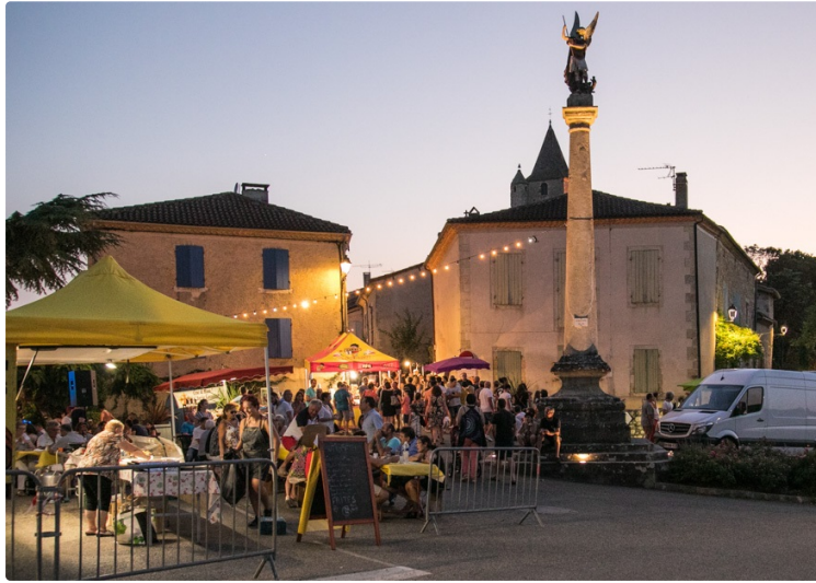
Les petits marchés préparent leur nouvelle édition

Les prochaines dates des marchés nocturnes à Lavardens sont dévoilées.