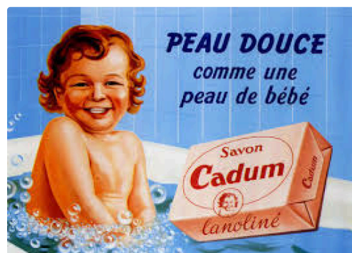
pub antan 3.jpg

L'exposition est visible du 15 septembre au 15 décembre 2015 aux Archives départementales du Gers les Lundis, mercredis et vendredi de 9 heures à 17 heures et chaque mardi de 13 à 17heures - Parc départemental du Gers 81 route de Pessan à Auch