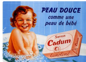
AUCH la pub d'antan

Témoignage d'un patrimoine qui disparaît