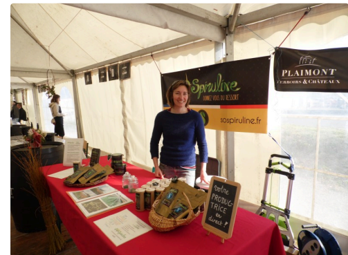
De la spiruline et du sourire en prime