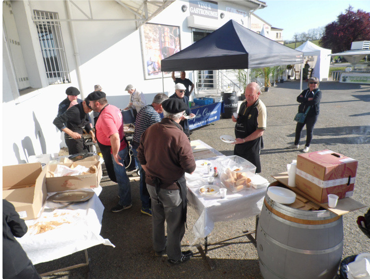
Saint Mont vignoble en fête

Après la journée pédagogique du vendredi, suivie par de nombreux étudiants, samedi et dimanche étaient moins studieux, plus pour goûter au plaisir festif.