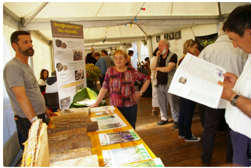
La forêt d'Occitanie était bien expliquée