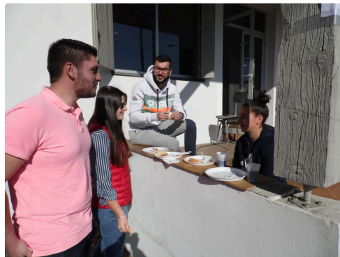
D'autres préféraient les œufs ventrèches