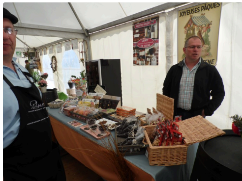
Candy et ses douceurs gustatives

Il y avait aussi du soleil et la douceur du temps, ce qui à l'évidence n'a pas de prix.