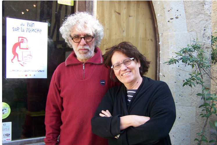
"Du pain sur la planche"

Une exposition inhabituelle à la Maison des Illustrations