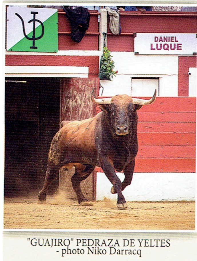
Rencontres taurines du samedi 30 mars

Samedi 30 mars , lors des rencontres taurines, sera présentée la feria 2019.