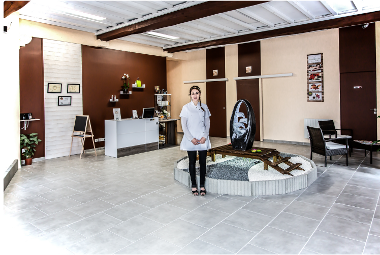
Un somptueux centre de bien-être et de beauté à Nogaro

Le centre Ô Bien-être vient d'ouvrir à Nogaro, au carrefour de l'avenue du Midour et de l'avenue de Daniate. Dès l'entrée, on est saisi par la paix qui émane des lieux, aménagés tendance japonisante. Avec de larges espaces, qui permettent aux fauteuils roulants de se déplacer facilement, c'est un site très accueillant.