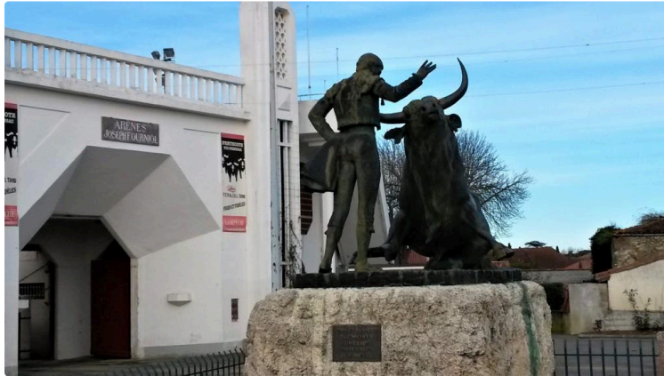
Club taurin vicois

Samedi 30 mars, à Vic-Fezensac, auront lieu les rencontres taurines au cours desquelles la Feria 2019 sera présentée et les prix suivants seront remis :