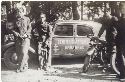
Le Bataillon devient demi-brigade sous l'afflux des volontaires