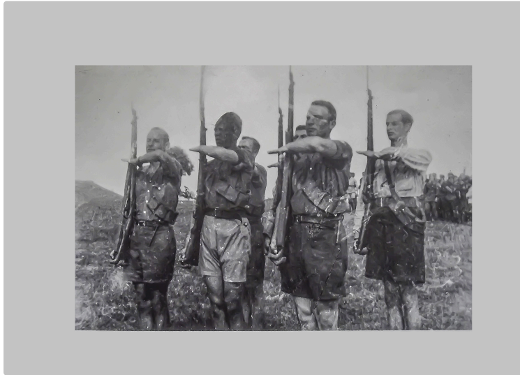
« Le Bataillon de l'Armagnac », illustre et mal connu

Histoire vivante d'une Résistance exemplaire