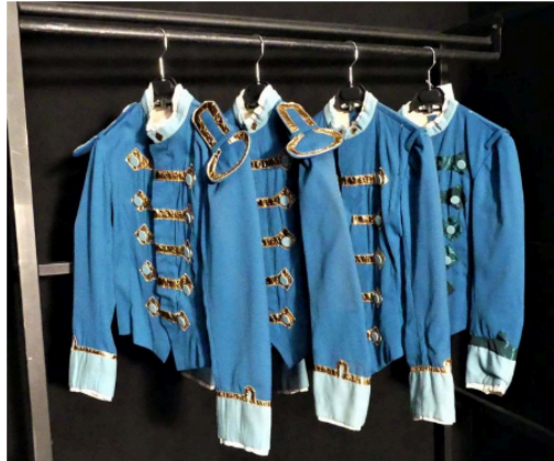
Des costumes du Capitole vendus aux enchères

Le dimanche 17 mars à partir de 10h30 au Théâtre du Capitole à Toulouse, 191 lots de costumes seront dispersés sous le marteau de la célèbre maison Drouot.