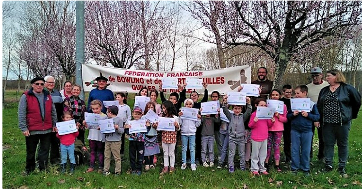
Les quilles au maillet séduisent les plus jeunes

Le mercredi 6 mars, entre soleil et nuages, les centres de Loisirs Val de Gers de Masseube, Pavie et Seissan sont venus à Sansan pour une initiation organisée par le foyer rural d'Orbessan et le Comité département de Quilles au Maillet du Gers.