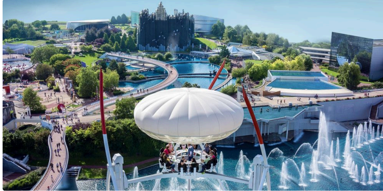
Futuroscope : nouveau cap sur l'avenir

Une offre diversifiée et un deuxième parc d'attractions pour les plus jeunes