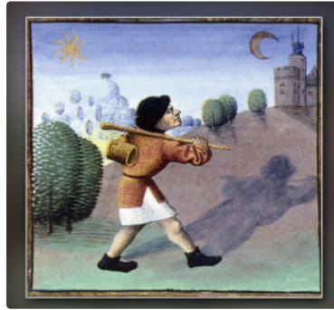
Un chemin de St Jacques

L'association "Un Chemin de Saint-Jacques - La voie de Rocamadour en Limousin et Haut-Quercy" a eu la bonne idée de déporter le lieu de son assemblée générale à La Romieu, ce dimanche 3 mars. En effet, notre village est l'étape finale de cette portion du chemin de Saint Jacques matérialisée par une borne érigée place Bouet, l'été dernier. Mais c'est dans la Creuse que l'aventure a commencé, en janvier 2009, avec la réhabilitation et le balisage d'un chemin entre Bénévent L'Abbaye et Rocamadour, soit 270 km. Après un travail acharné de tous les bénévoles de l'association, d'abord pour trouver un financement, puis en se retroussant les manches, deux ans et demi après, la voie était ouverte en juillet 2011. Pour bien connaître la région à titre personnel, je ne mets pas en doute les témoignages de pèlerins qui n'hésitent pas à écrire : « C'est le plus beau chemin que nous ayons fait ». Eymoutiers, Treignac, Chaumeil, tout évoque les puys couverts d'épicéas et de douglas, et dans la vallée, les rivières aux eaux cristallines qui descendent de Millevaches. Les 2.510 marcheurs dénombrés en 2018 par le compteur mis en place ont eu le plaisir d'en profiter.