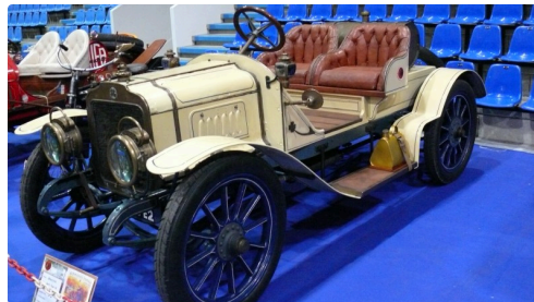
Brasier sport de 1907.