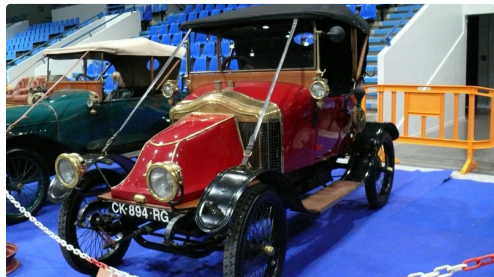
Clément-Bayard de 1913.