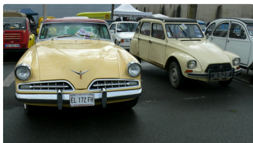
La grosse limousine côtoie la Dyane et la 2 CV.