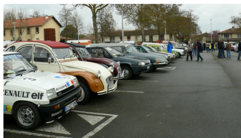
Vue de véhicules anciens.