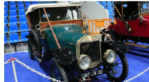
Exceptionnel véhicule d'avant 14, Terrot de 1913.