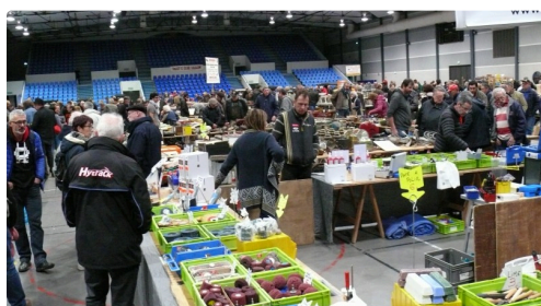
Ce sont quelques 2.000 visiteurs qui sont venus à la manifestation.