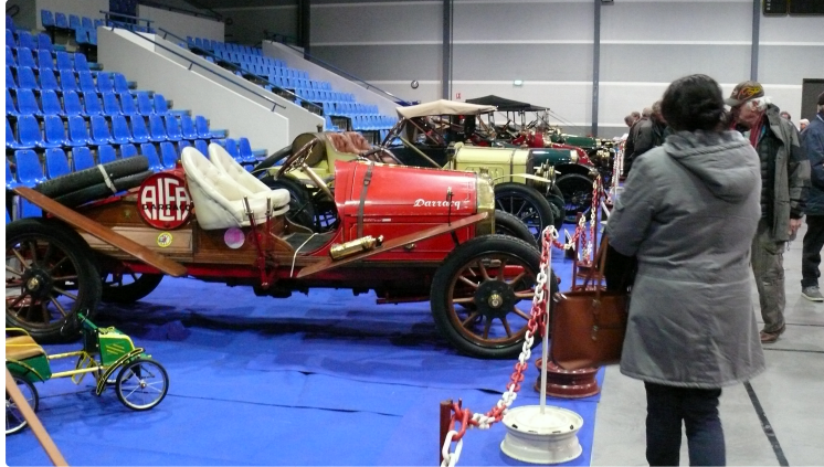
Gros succès populaire de la bourse d'échanges du Tacot's club Gascon

Le rideau est tombé ce dimanche 3 mars sur la 45ème édition de la bourse d'échanges du Tacot's club Gascon. Quelques 2.000 visiteurs venus de tout le Grand Sud-Ouest ont pu admirer durant deux jours « les vieux tacots » de nombreux particuliers et « les véhicules d'avant 14 » appartenant aux adhérents du club.