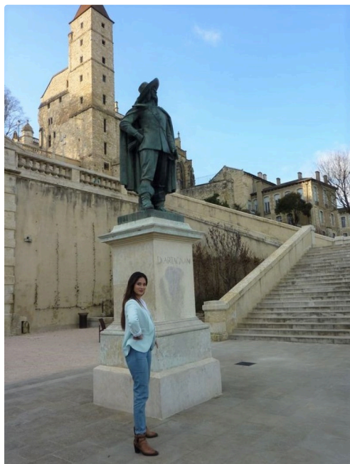
Pose avec D'Artagnan.