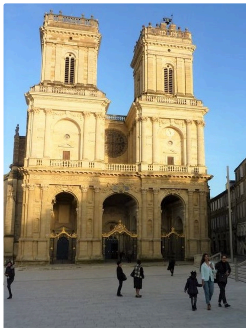
Sur le parvis de la cathédrale.