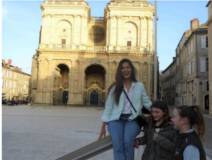
Miss Népal visite Auch

Accompagnée et guidée par plusieurs membres de l'association Gers Himalaya, Miss Népal Word 2018 a parcouru les pusterles, ces rues pentues qui mènent de la ville haute à la rive du Gers. Puis elle a longuement visité la cathédrale, émerveillée en particulier par les vitraux richement décorés.