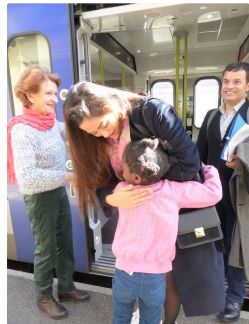
Adieu, bon voyage !