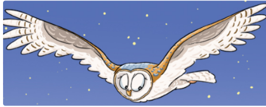
Sortie nature à la découverte des rapaces nocturnes

Dans le cadre de l'Atlas de la Biodiversité du Grand Auch Cœur de Gascogne et pour la 13 ème édition de la Nuit de la Chouette, le Groupe Ornithologique Gersois, créé en 1990 et baptisé La Tchourre (*), vous convie, le samedi 2 mars 2019, de 19 h 30 à 22 h , à le rejoindre pour une sortie nocturne, à la découverte des rapaces présents sur la commune de Lavardens.