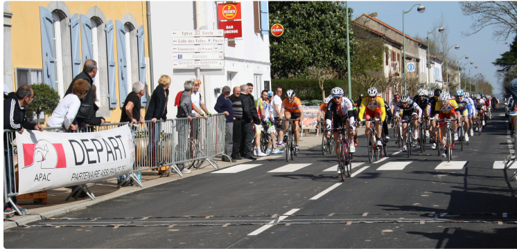
L'épreuve cycliste sillonnera les routes du pays de l'Adour gersoise

Le Tour Cycliste du Madiranaise 2019 laisse la part belle à des étapes ouvertes.