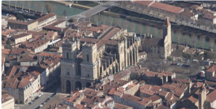
Comment profiter de ses vacances pour découvrir la ville

Choisissez parmi les rendez-vous du pays d'art et d'histoire