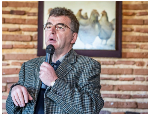
Un conférencier très vivant