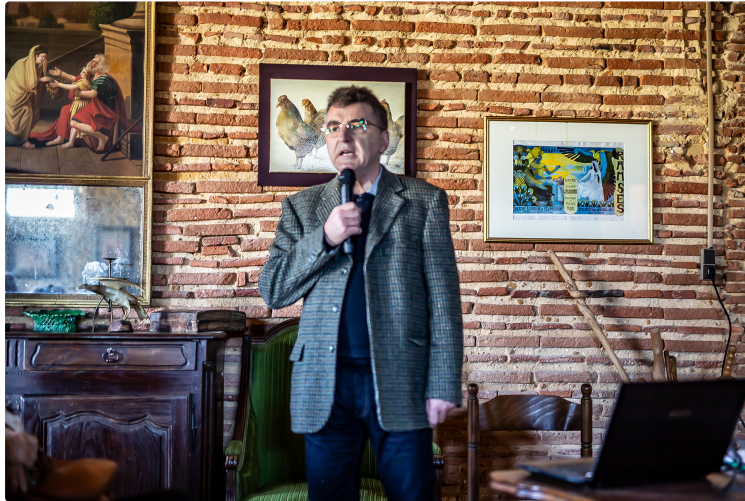
Pêche : histoire des étangs de l'Armagnac

Après la pêche traditionnelle dans la matinée du 23 février, la municipalité de Perchède organise une conférence au château de Pesquidoux, sur le thème de L'histoire des étangs de l'Armagnac, par Jacques Lapart (1).