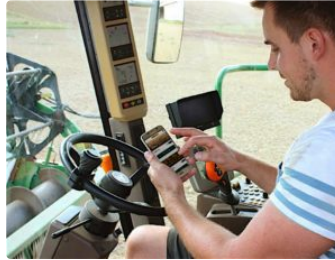
Vendre ses céréales au bon prix, au bon moment

L'application mobile Perfarmer, conçue pour les céréaliers, sera présentée au Salon international de l'agriculture, qui ouvre ses portes aujourd'hui à Paris. Elle va leur permettre, via leur smartphone, d'ajuster le prix de vente de leurs récoltes en fonction de la taille et des charges de leur exploitation, ainsi que des cours du marché en temps réel.