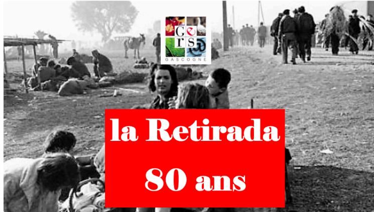
"la Retirada" il y a 80 ans.

La guerre d'Espagne a entraîné le départ de plusieurs vagues de réfugiés vers la France, de 1936 jusqu'en 1939 où la chute de Barcelone provoque, en quinze jours, un exode sans précédent. Près d'un demi-million de personnes franchissent alors la frontière des Pyrénées, dans de terribles conditions. C'est la Retirada.