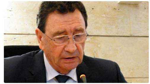
Raymond Vall sénateur du Gers