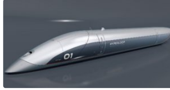
Hyperloop, le bolide à lévitation magnétique

Il serait capable de relier Toulouse à Paris en 40 minutes