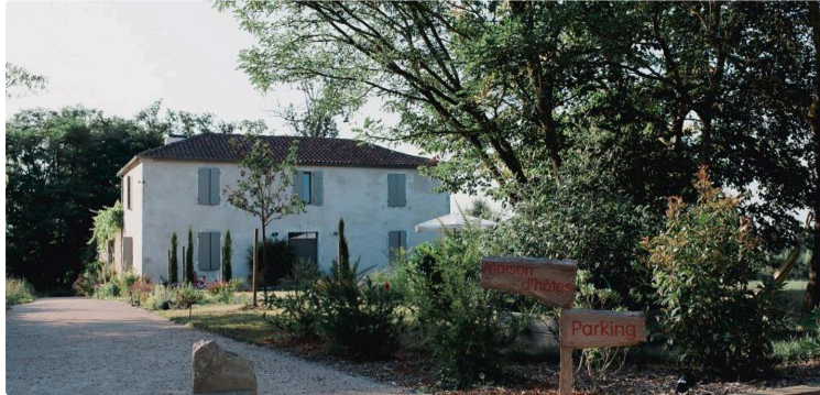
Lassenat Eco-Maison d'hôtes en Gascogne

Nouvel hébergement labellisé ... Hébergers