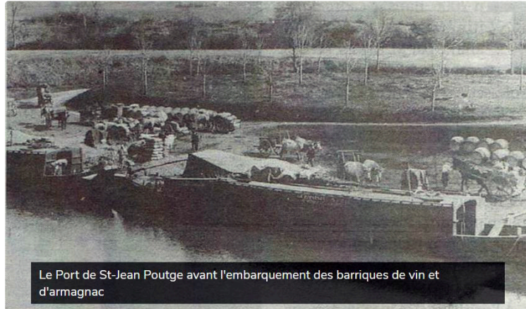
Quand la Baïse était navigable

Le mardi 19 février, la section randonnée de l'association de la gymnastique volontaire vicoise a choisi le secteur de Pléhaut (près de Saint-Jean Poutge) pour le circuit de sa marche du mardi. Peut-être les randonneurs emprunteront-ils le chemin de halage où pendant des décennies des attelages de boeufs et de chevaux tirèrent la gabarre.