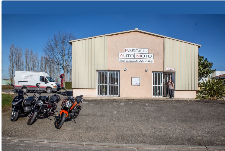
L'intérêt de créer une nouvelle auto-école à Nogaro

Audrey Necili explique pourquoi elle y croit