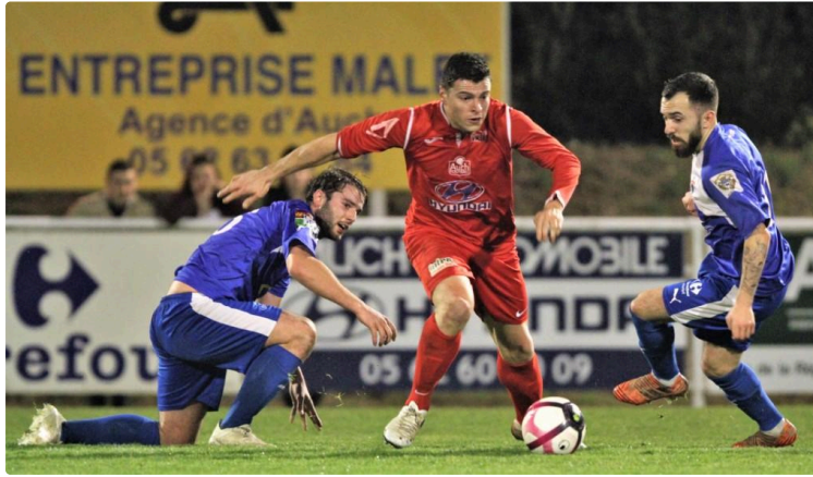
Football : Auch confirme sa suprématie face à Fleurance

Un derby qui a permis aux Auscitains de se remettre en confiance, Fleurance par contre continue à douter