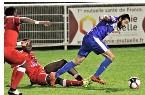
Rush rageur du Fleurantin. (Photo : Jean-Marc Ramel).