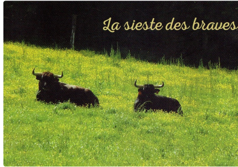
Deux des toros de Jean-Louis Darré qui seront lidiés, à Eauze