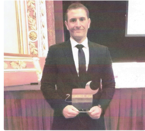
Prix du meilleur picador pour Gabin